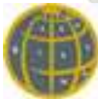
Gambar 2.4 Bidang Grafis Bumi