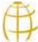
Gambar 2.3 Sumbu