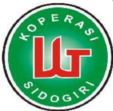
Gambar II. 2 Logo BMT UGT Sidogiri