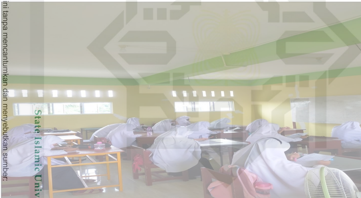
الصورة ٢ UIN SUSKA RIAU