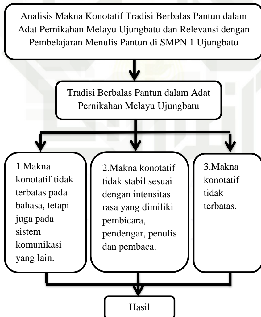
Gambar 2.1: Bagan Kerangka Berpikir