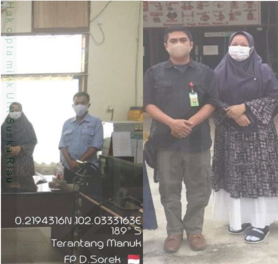
Dokumentasi saat pengumpulan data di PT. Arara Abadi (2021)