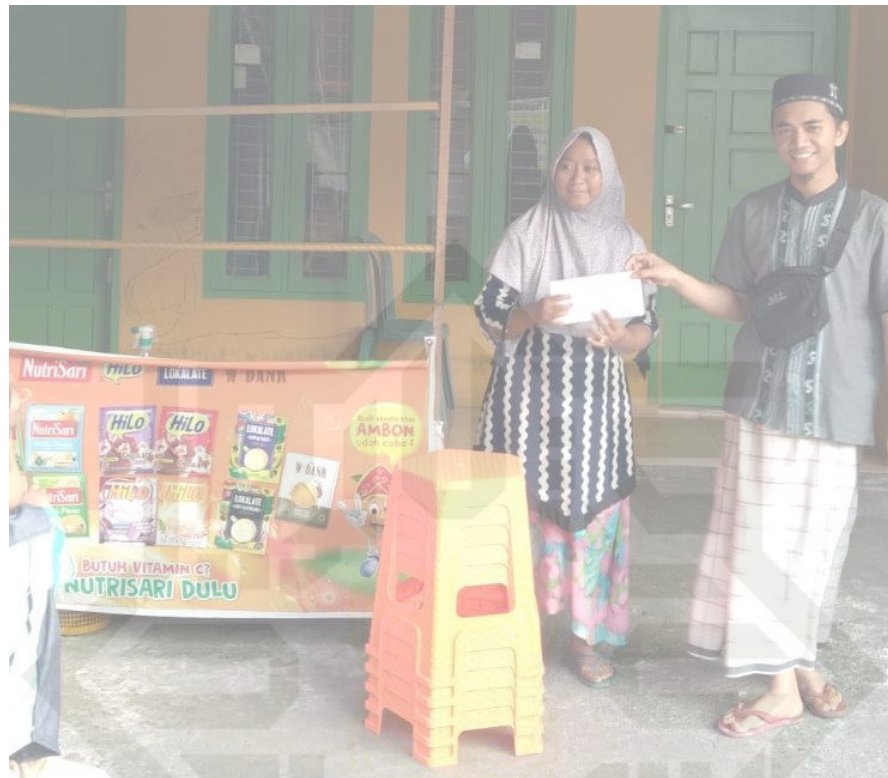
Gambar 5.2. penyerahan bantuan modal usaha