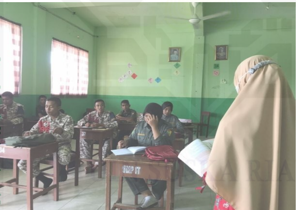
State Islamic University of Sultan Syarif Kasim Riau