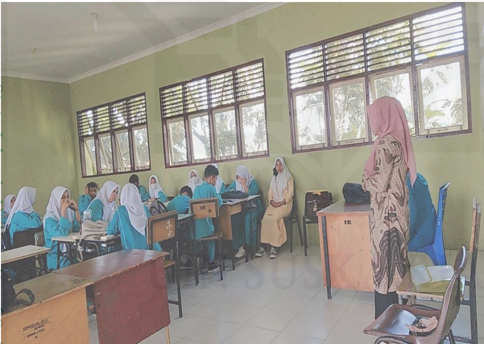
Kegiatan penyebaran angket

State Islamic University of Sultan Syarif Kasim Riau