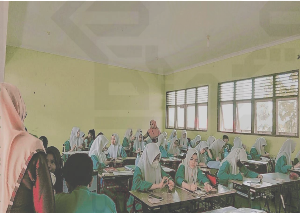
Proses Belajar Mengajar

State Islamic University of Sultan Syarif Kasim Riau