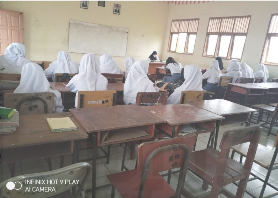
Proses Belajar Mengajar