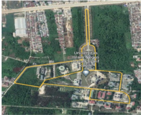
Gambar 2. Rute Penelitian