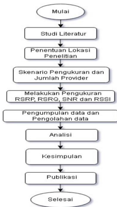
Gambar 1. Flowchart Penelitian

Untuk tahapan metodologi dimulai dari studi literature dan diakhiri dengan publikasi, untuk lebih jelasnya dapat dilihat pada gambar Flowchart dibawah ini.