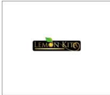
Gambar 2.1 Logo LemonKita