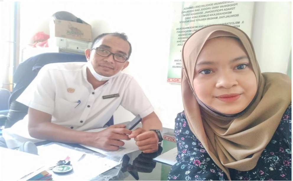
Wawancara bersama Sekretaris Lurah