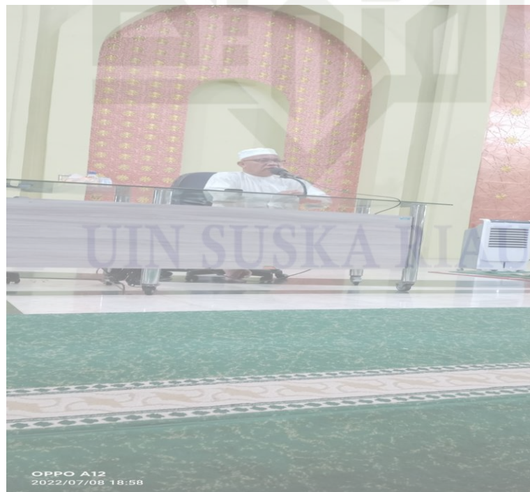
Foto Kegiatan Keagamaan