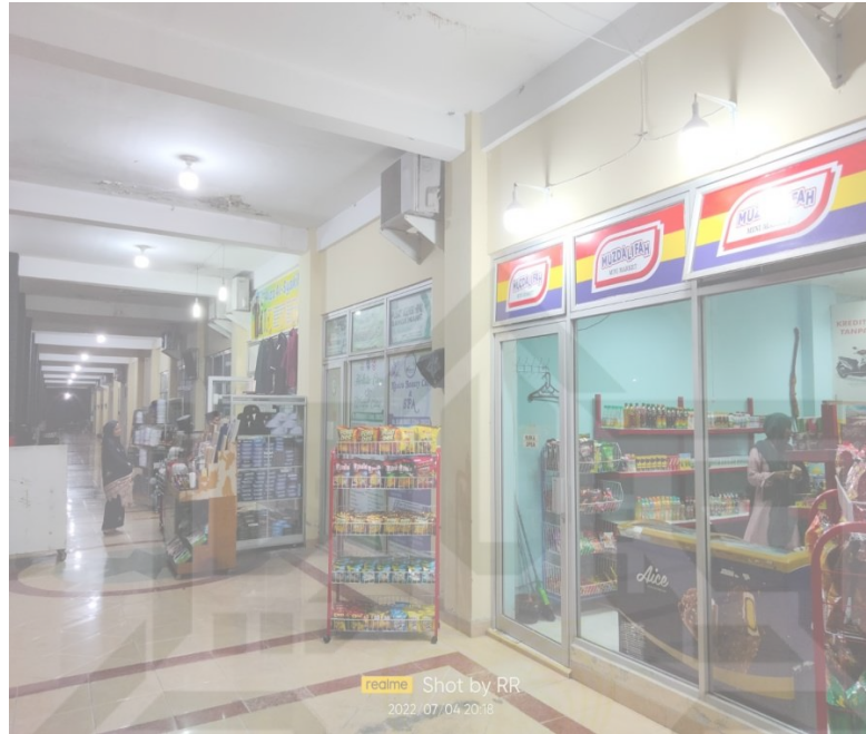
Foto UMKM kompleks Islamic Center