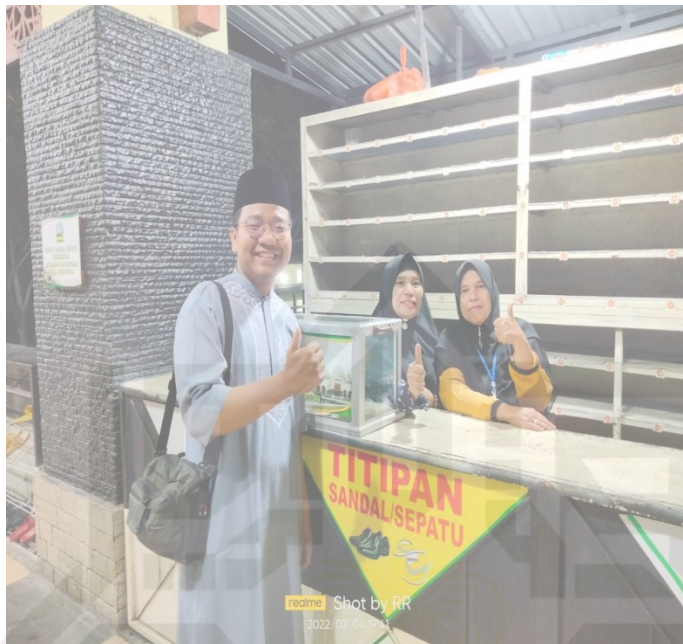
Foto bersama divisi kebersihan