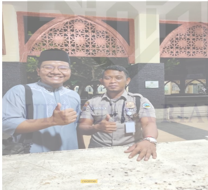
Foto bersama divisi keamanan