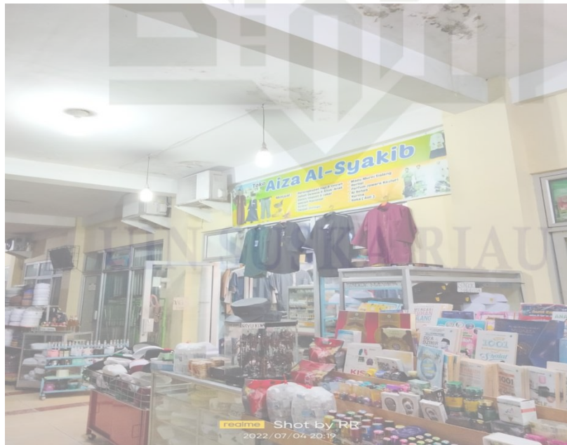
Foto UMKM kompleks Islamic Center