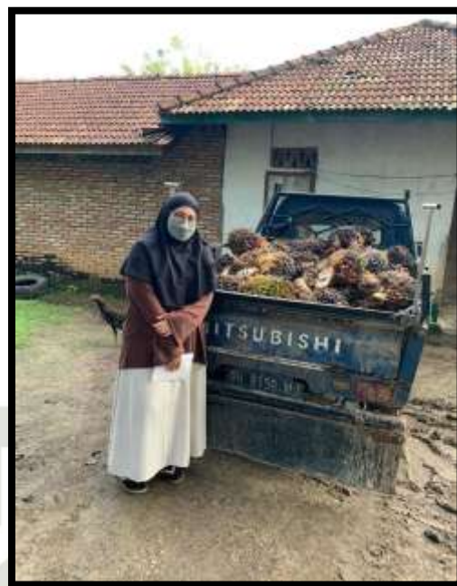
Dokumentasi pengisian kuisisioner penelitian bersama petani kelapa sawit di Desa Sekernan