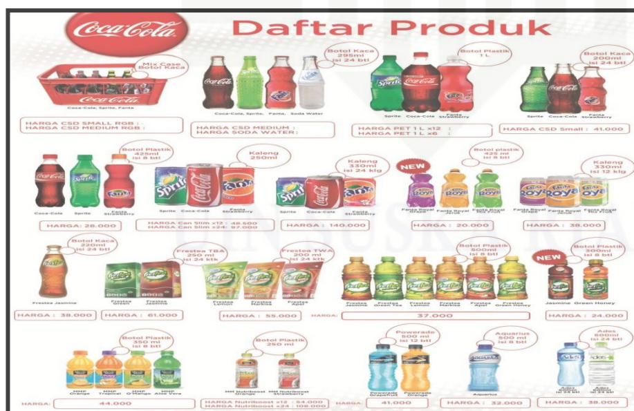
Gambar 2.1 Daftar Produk PT. Coca Cola