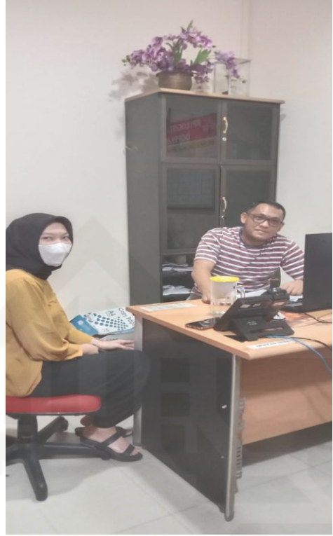
Proses wawancara dengan admin load supervisor