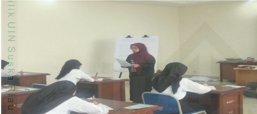
proses tes tertulis