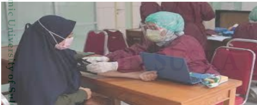
Proses Tes Kesehatan