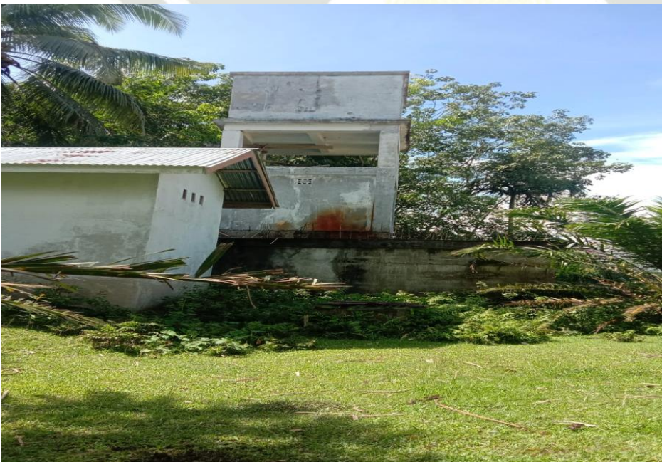
Sumur Bor Pebaun Hilir