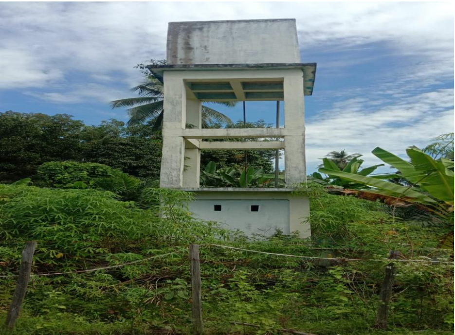
Sumur Bor Desa Saik