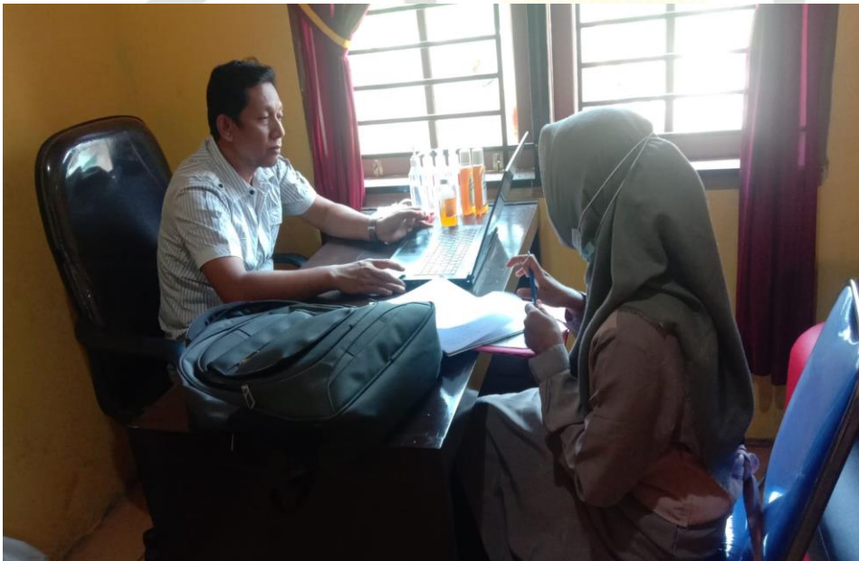
Wawancara Dengan Kepala Dinas Perumahan, Kawasan Permukiman Dan Pertanahan