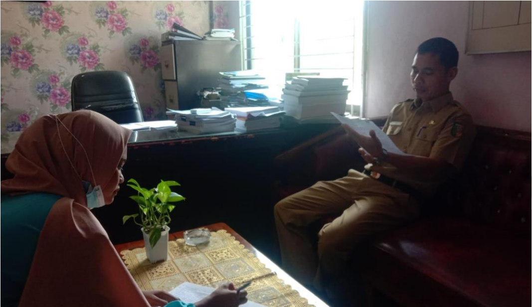
Wawancara Dengan Kepala Desa Pebaun Hilir