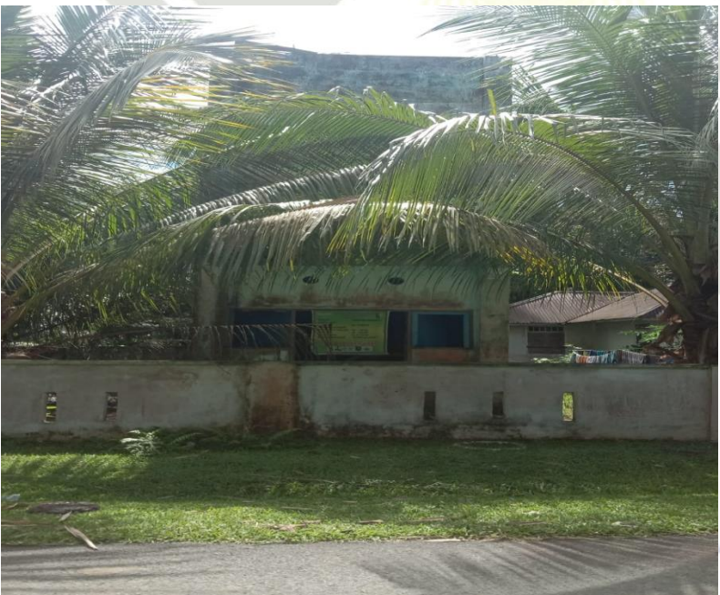
Sumur Bor Pebaun Hulu