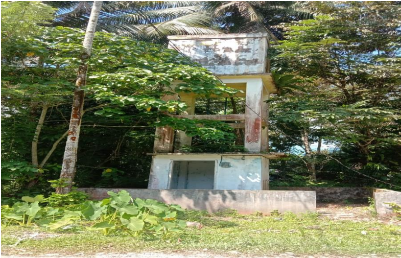
Sumur bor Desa Pulau Binjai