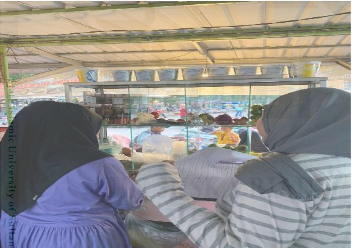
Mewawancarai kakak penjual jus dan pop ice