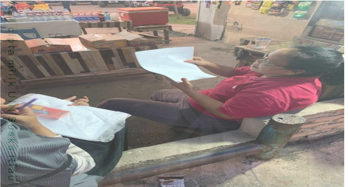
Mewawancarai ibu penjual minuman di depan Kaharuddin Nasution