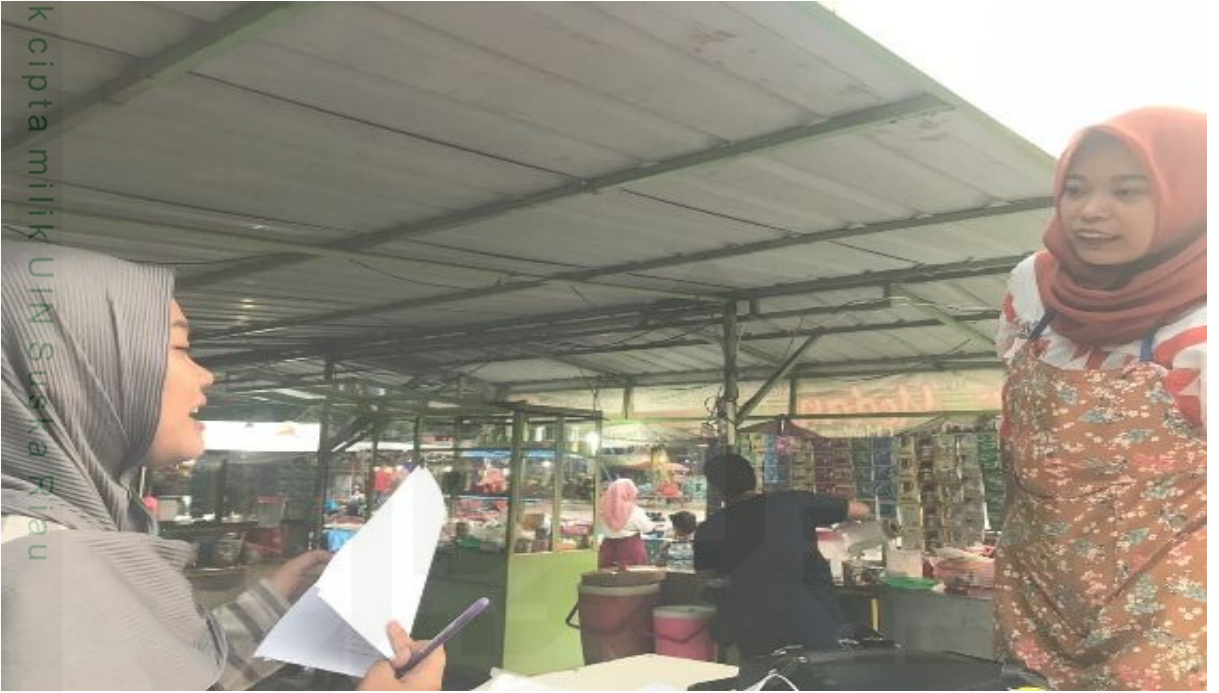
Mewawancarai kakak penjual mie