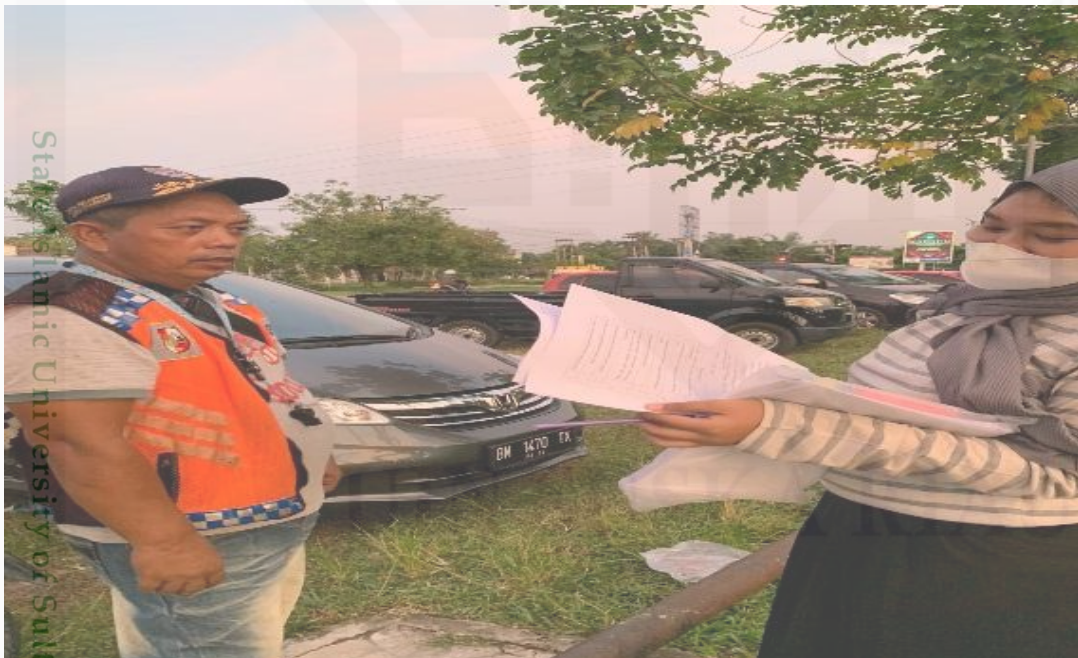
Membagikan angket kepada tukang parkir