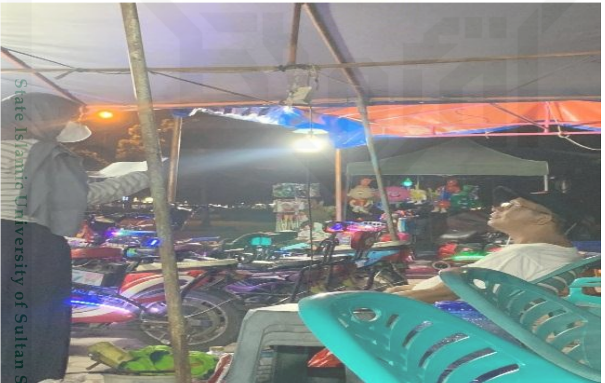
Mewawancarai bapak tukang mobil mobilan