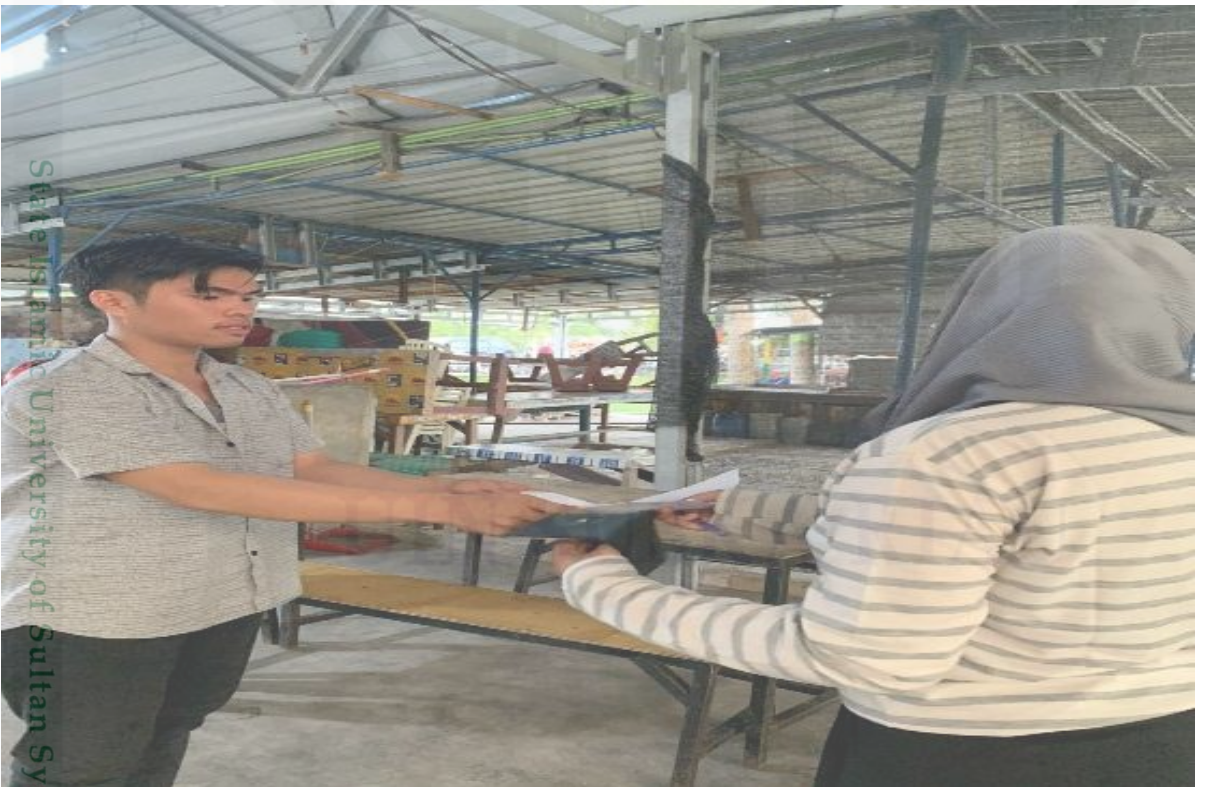
Membagikan angket kepada abang abang tukang sate