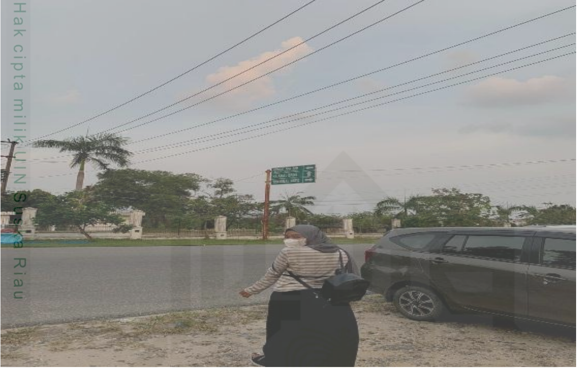
Bukti kalau penulis sedang berada di lokasi