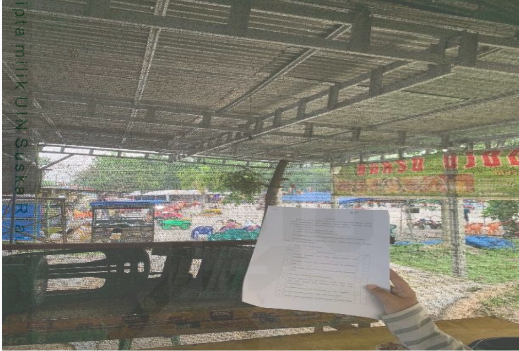
Memulai membagikan angket di depan Stadion Kaharuddin Naution