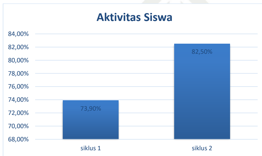
Gambar IV.2 Grafik Perbandingan Aktivitas Siswa Siklus I dan Siklus II

Peningkatan aktivitas siswa dalam menerapkan model Take and Give pada siklus I dan siklus II dapat juga dilihat pada gambar IV.2 di bawah ini: