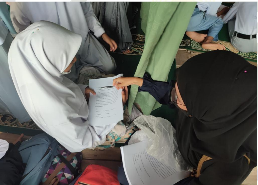
Prof Sultan Syarif Kasim Riau