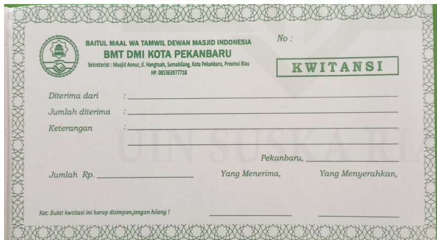
Gambar 8. Kwitansi BMT DMI Kota Pekanbaru