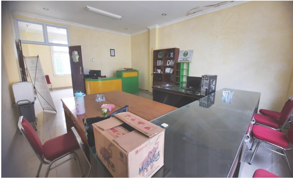
Gambar 10. Ruangan BMT DMI Kota Pekanbaru