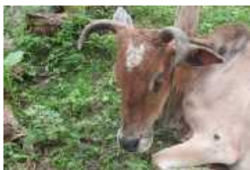
Melengkung ke depan