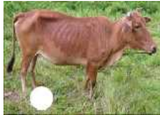
Cokelat merah bata