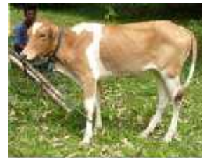
Belang putih coklat