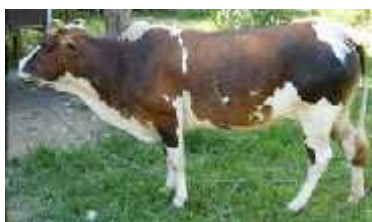
Belang hitam putih