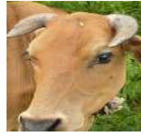
Melengkung menyamping ke depan