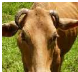
Melengkung ke bawah