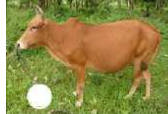
Cokelat warna sapi Bali