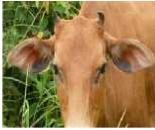
Tanduk pendek dan kecil