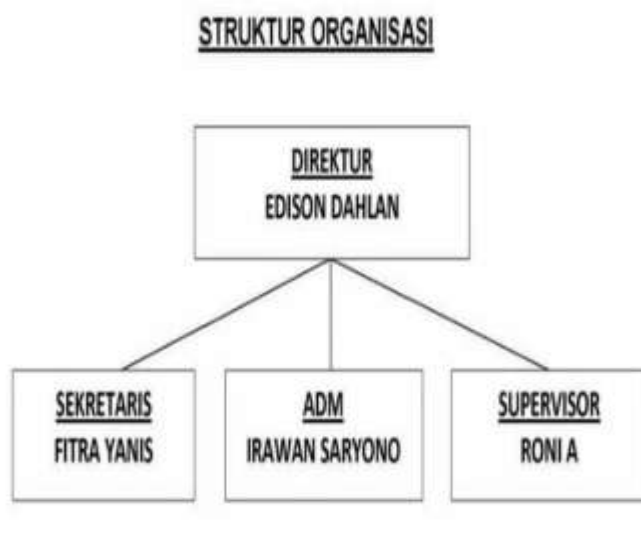
Gambar 2.1 Struktur Organisasi PT.Naufal Pratama

Untuk mengetahui lebih lanjut tentang struktur organisasi PT. Naufal Pratama, maka penulis akan menerangkan tentang tugasnya yaitu :