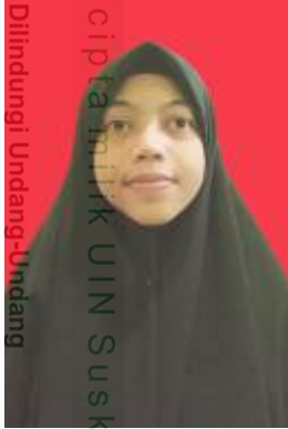
Hak Cipta Diindungi Undang-Undang