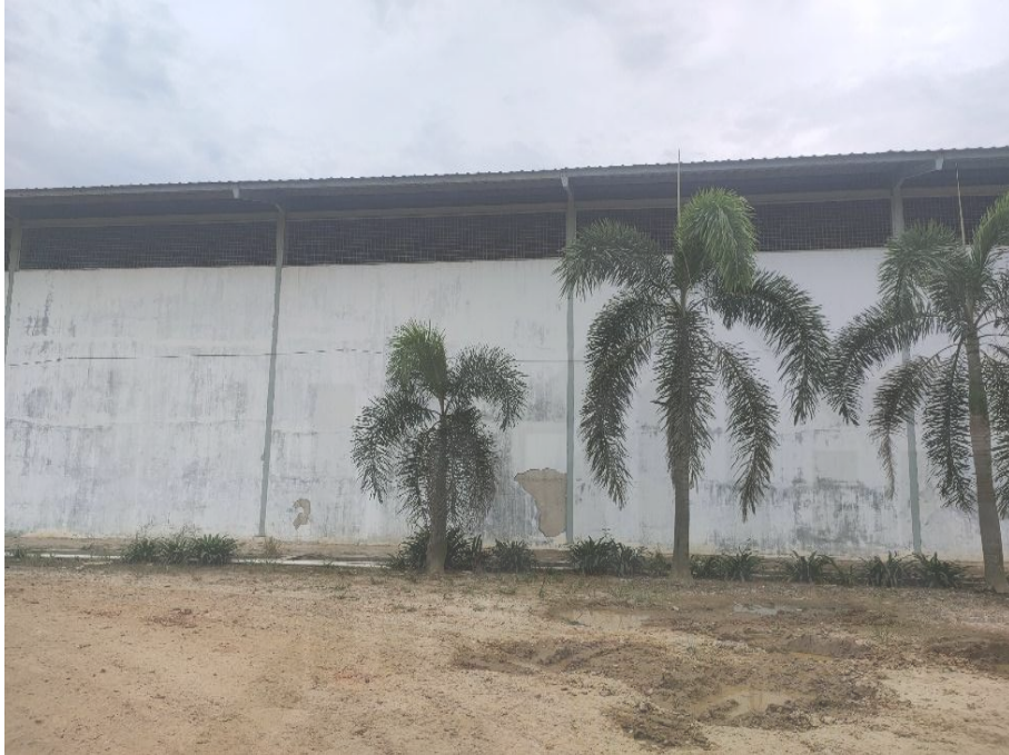
Foto Kantor Perkebunan PT. Andika Permata Sawit Lestari