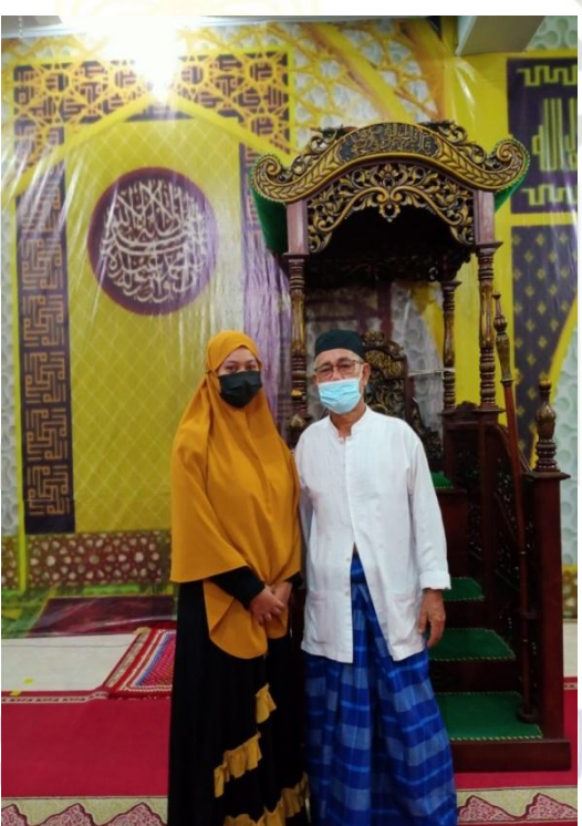
Sultan Syarif Kasim Riau