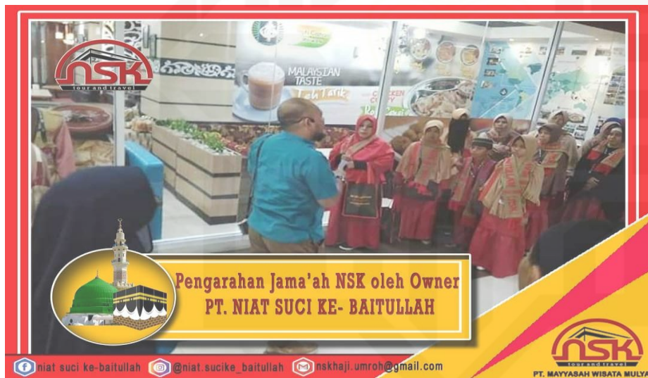
Gambar 4. Foto pengarahan jamaah umroh oleh Owner PT NSK sebelum keberangkatan

State Islamic University of Sultan Syarif Kasim Riau