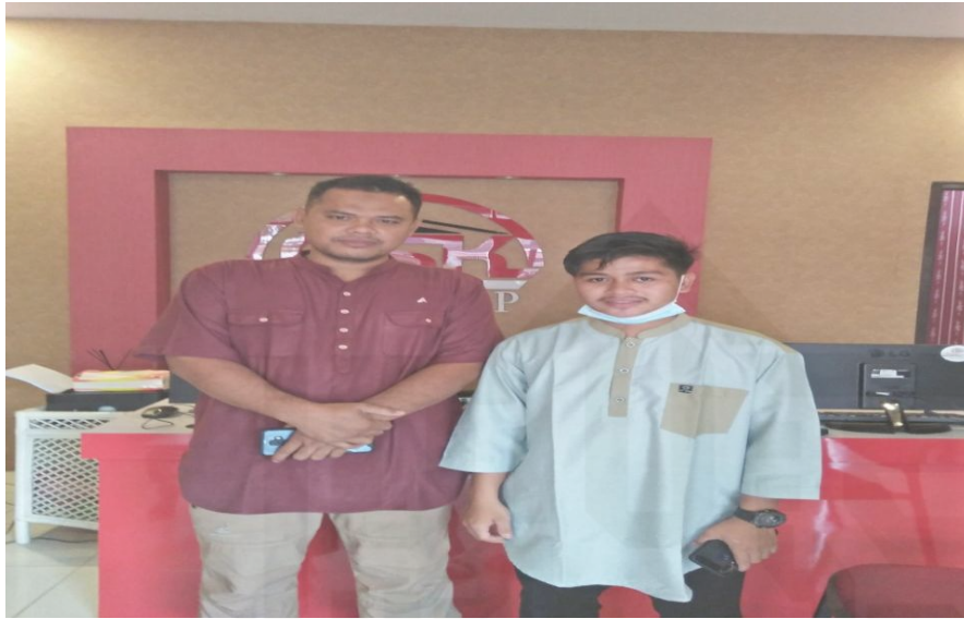
Gambar 1. Foto bersama Karyawan PT NSK