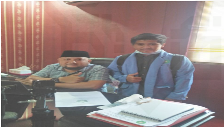
Gambar 2. Foto bersama direktur PT NSK