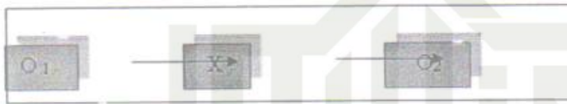
Gambar 1. Rancangan Penelitian The One Group Pre-test Post-test Design

Pemberian Post-test setelah diberikan perlakuan. Tujuan post-test yaitu untuk mengetahui hasil apakah teknik modeling simbolik dalam bimbingan karir efektif untuk meningkatkan perencanaan karir siswa. post-test ini dilakukan setelah 8 kali pertemuan.