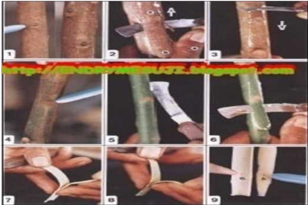
Gambar 2.1. Pembuatan perisai mata okulasi: 1. Bentuk mata batang yang akan diokulasi; 2. Cara pengirisan kayu untuk okulasi; 3. Untuk bukaan dari atas mata entres menghadap ke atas; 4. Untuk bukaan dari bawah mata entres menghadap ke bawah; 5. Penyayatan mata entres; 6. Penyayatan mata entres yang mengandung kayu; 7,8. Pemisahan kayu dan kulit pada mata entres; 9. Mata entres yang mempunyai tonjolan putih di tengah.

berlubang berarti mata-nya tertinggal pada bagian kayu dan perisai ini tidak boleh ditempelkan pada batang bawah. tahapan kegiatan tersebut dapat dilihat pada Gambar 2.1.