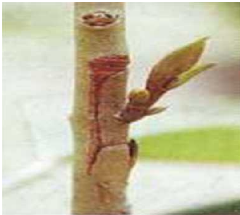
Gambar 2.3. Hasil tanaman okulasi durian yang sudah jadi.

Menurut Ashari dan wahyuni (2010) kegiatan pembukaan dan pemeriksaan perisai mata okulasi: a. Setelah okulasi berumur 2-3 minggu, maka balutan okulasi dapat dibuka untuk diperiksa keberhasilannya. b. Balutan dibuka dengan cara mengiris plastik okulasi dari bawah ke atas, tepat di samping jendela okulasi. Selanjutnya jendela okulasi dibuka dengan cara memotong lidah jendela okulasi. c. Keberhasilan okulasi dapat diketahui dengan cara membuat cungkilan pada perisai mata okulasi di luar matanya. Apabila cungkilan berwarna hijau berarti okulasi dinyatakan berhasil, dan bila berwarna coklat berarti tidak berhasil d. Okulasi yang berhasil ditandai dengan cara mengikatkan bekas potongan plastik okulasi pada bagian batang. Pencabutan bibit hasil okulasi untuk dijadikan stum mata tidur dapat dilakukan dengan dua cara, yaitu dengan menggunakan cangkul dan alat dongkrak bibit ( pulling jack ).