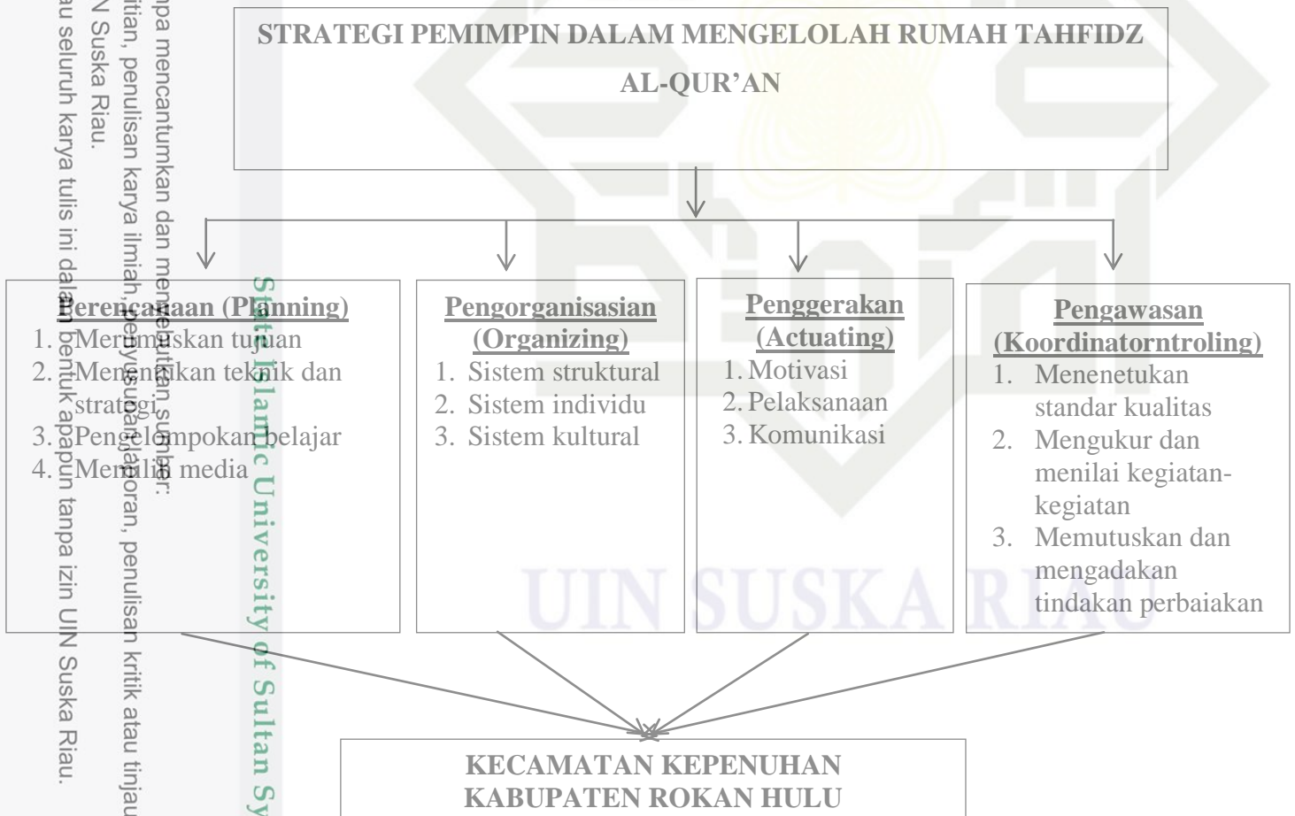
Tabel : 1.1 Skema Kerangka Pemikiran Penelitian

Adapun kerangka berfikir dalam penelitian ini adalah: