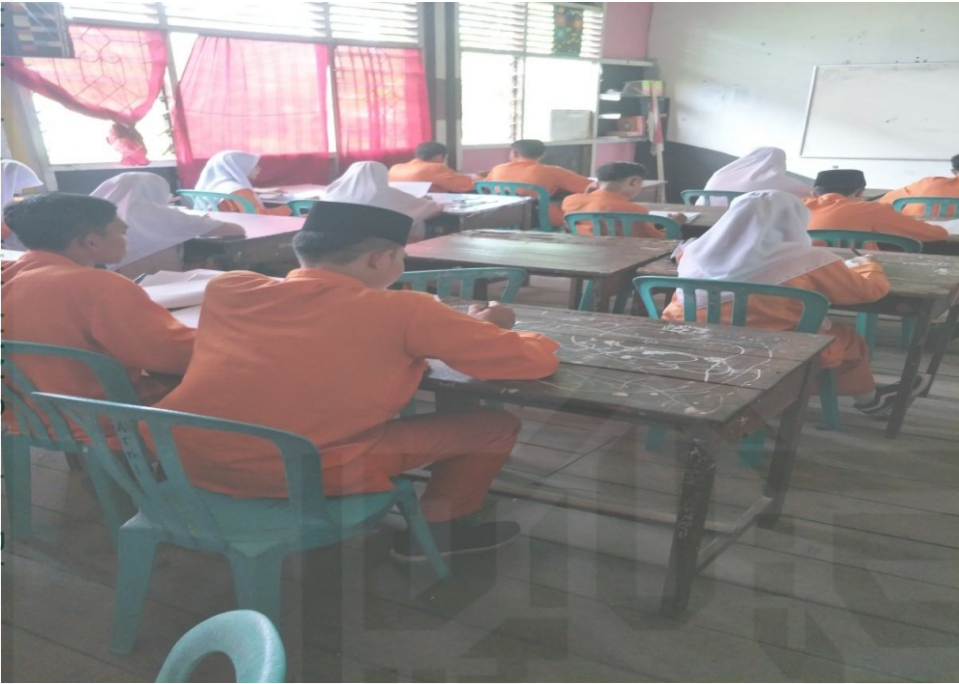
Observasi Sebelum Covid-19 di MAN 1 Inhil