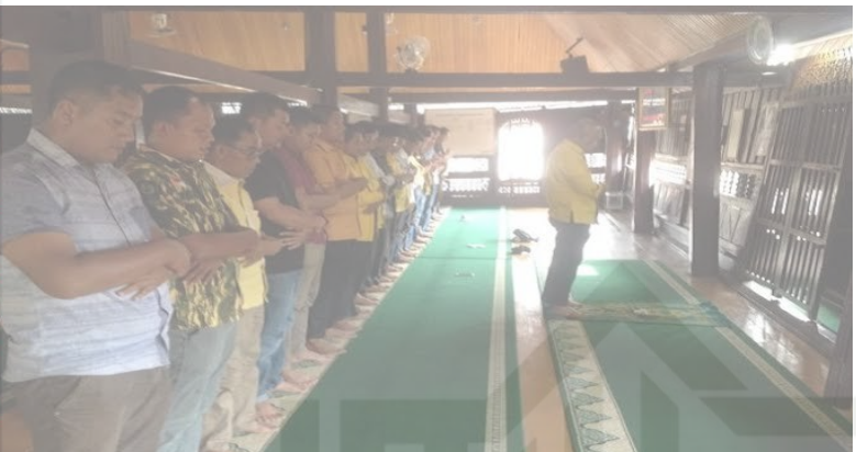
Shalat berjama'ah di Masjid Jami'