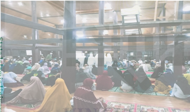
Kajian Dakwah di Masjid Jami'