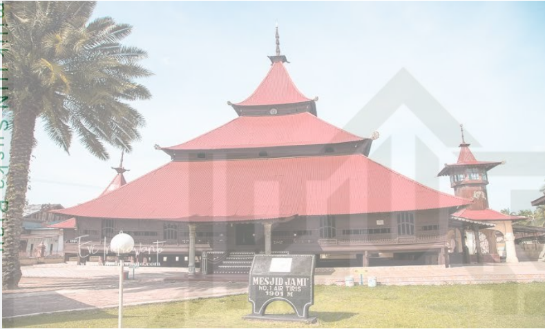
Dokumen tempat penelitian