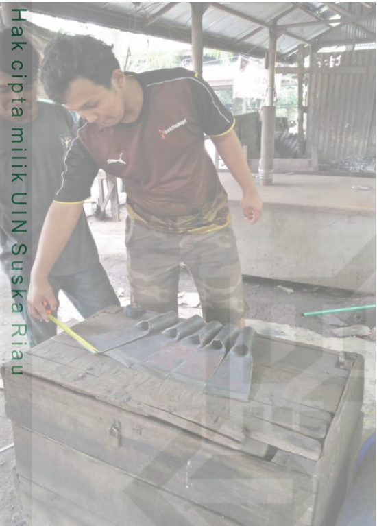
Gambar 3. : Hasil Dari Proses Usaha Sentral Pandai Besi Desa Teratak