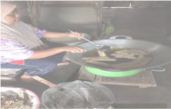
Gambar 2.5 Proses Penggorengan Pisang