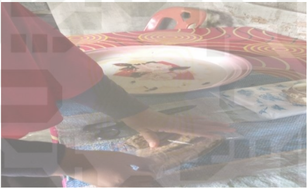
Gambar 2.6 Proses Pengemasan Pisang Press