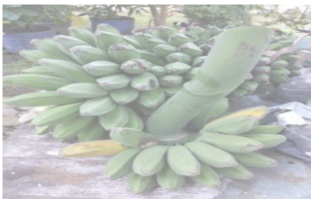
Gambar 2.1 Pisang Kepok