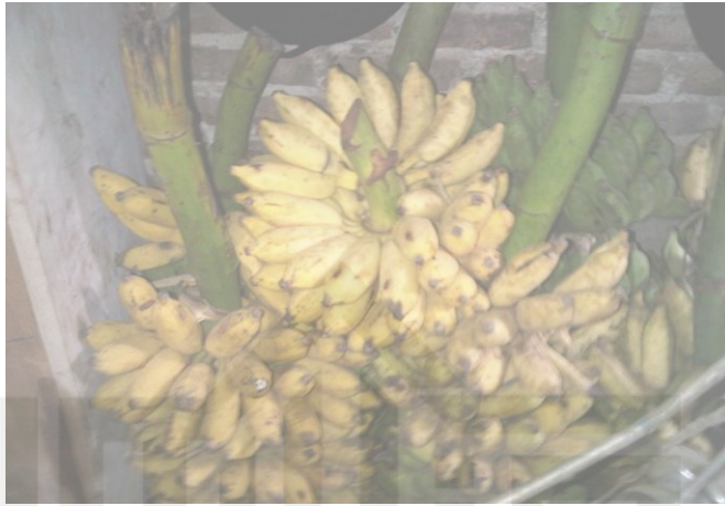
Gambar 2.2 Pisang Awak