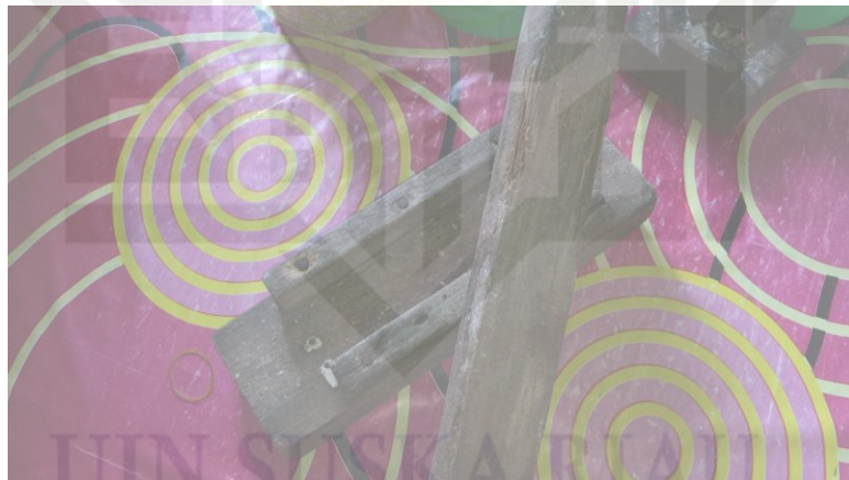
Gambar 2.3 Alat untuk Press Pisang