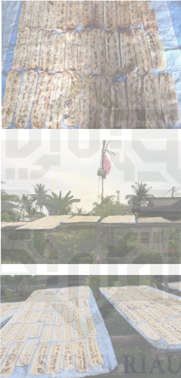
Gambar 2.4 Penjemuran Pisang