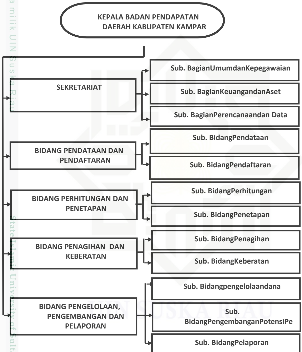
Gambar II.1 Struktur organisasi Kantor Badan Pendapatan Daerah