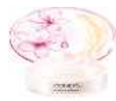
Translucent Pinkish White