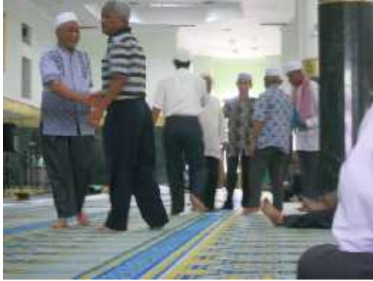
FOTO KEGIATAN DAN FASILITAS MASJID