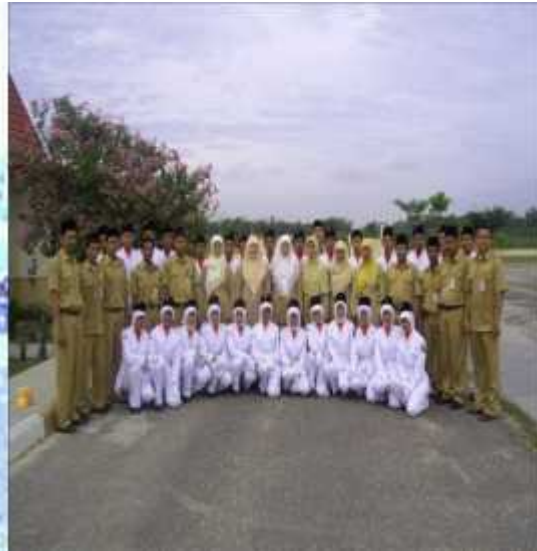
Kegiatan Pramuka yang dilaksanakan di desa Buluh Cina