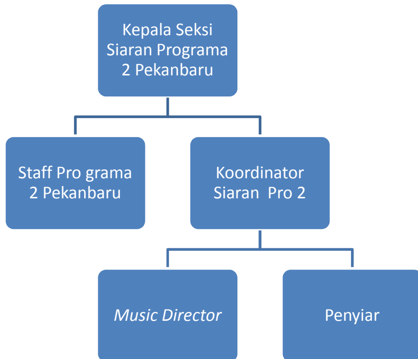
Gambar 2. Struktur RRI Programa 2 Pekanbaru

Pada gambar berikut ini akan terlihat Struktur RRI Programa 2 Pekanbaru,