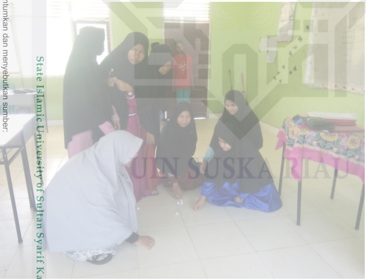
State Islamic University of Sultan Syarif Kasim Riau