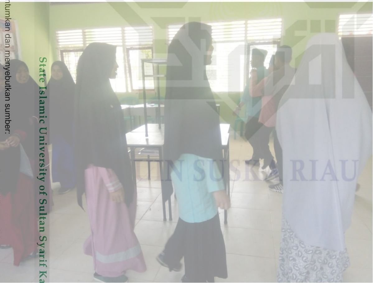
State Islamic University of Sultan Syarif Kasim Riau