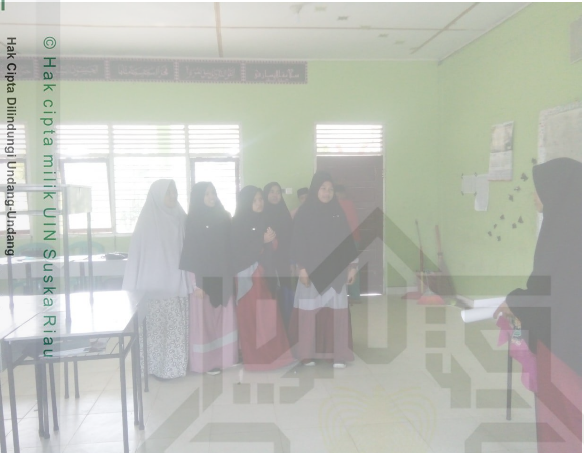
© Hak cipta milik UIN Suska Riau