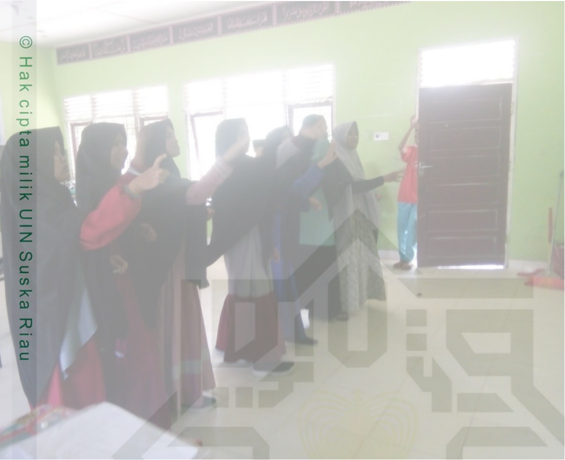
© Hak cipta milik UIN Suska Riau