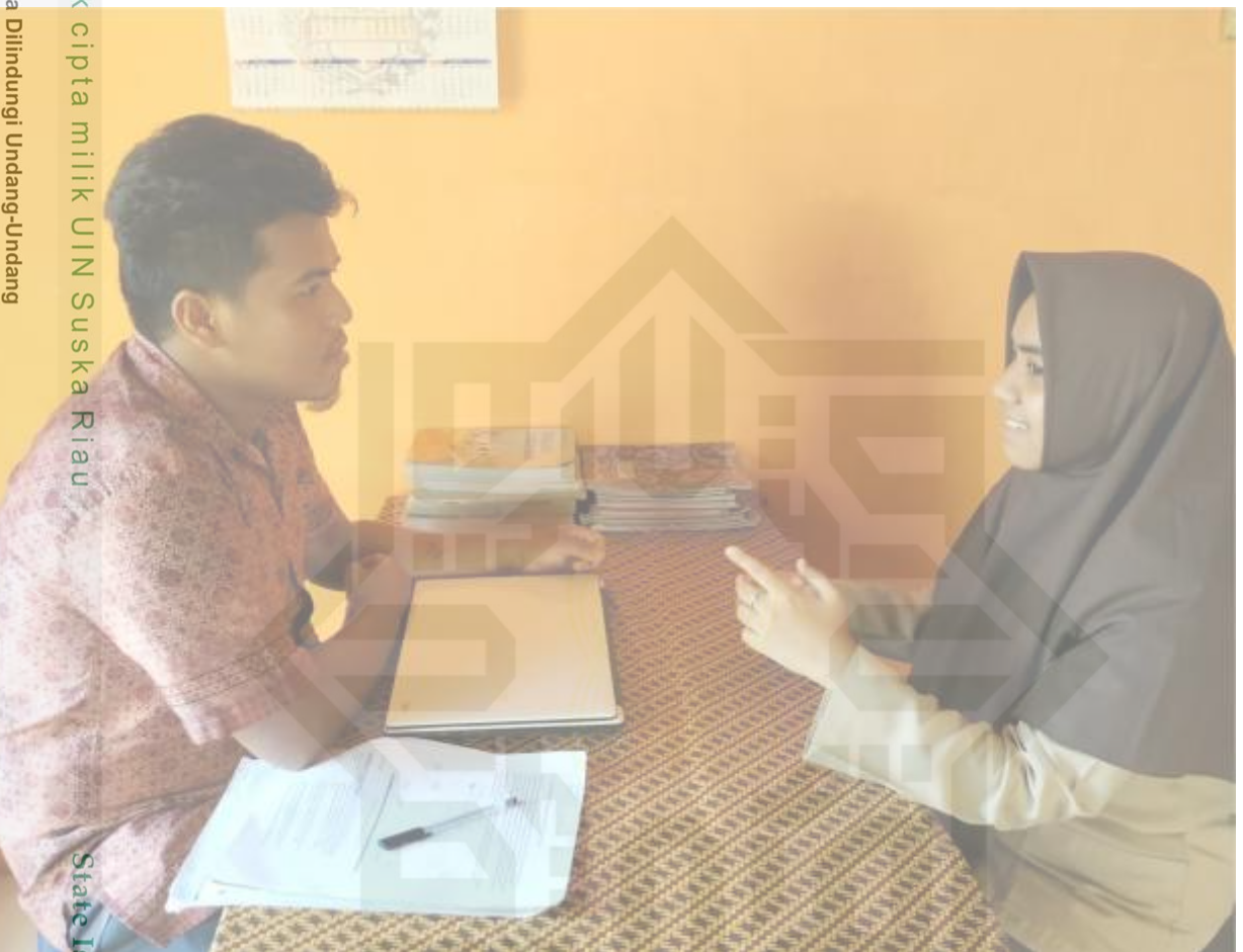
Keterangan: Pelaksanaan Konseling Individual