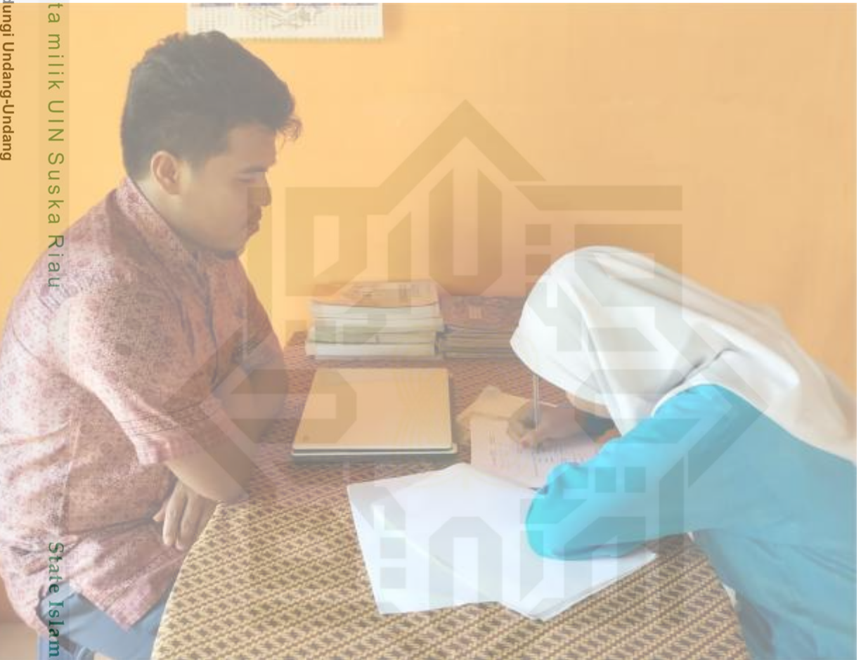
Keterangan: Pelaksanaan Post- Test