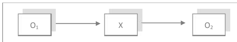
Gambar III.1 Rancangan Penelitian The One Group Pre-test Post-test Design