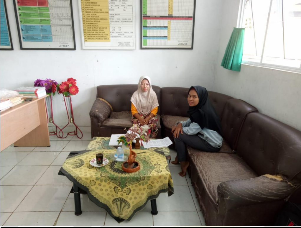
komite SDN 012 Desa Tanjung Gadai