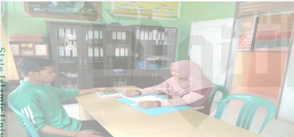
Foto penulis melakukan wawancara dengan Kepala UED-SP Gelugur Sejahtera dikantor desa pondok gelugur kecamatan lubuk batu jaya