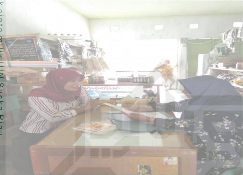
Foto penulis melakukan wawancara dengan Staf Bidang Keuangan UED-SP Gelugur Sejahtera