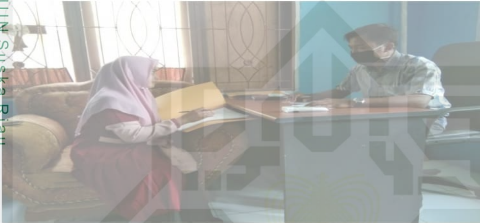
Foto penulis melakukan wawancara bersama Kepala Desa Pondok Gelugur dikantor desa pondok gelugur kecamatan lubuk batu jaya