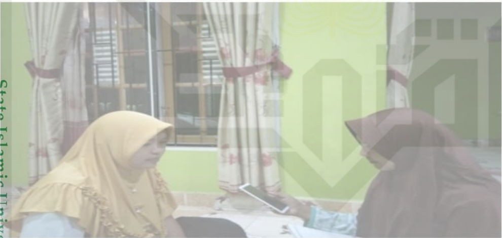
Foto penulis melakukan wawancara dengan masyarakat pemanfaat UED-SP Gelugur Sejahtera