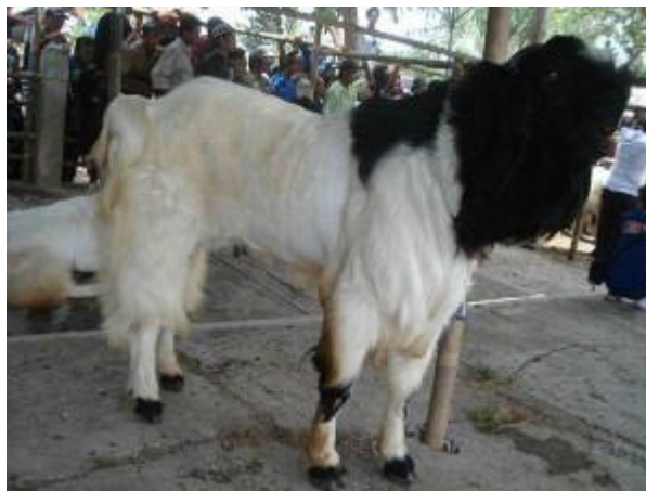
Gambar 3. Peranakan Etawah