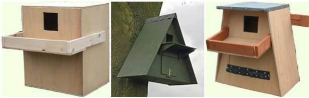
Gambar Rubuha (Rumah Burung Hantu)

Rubuha dibuat dari kayu atau tripleks di cat sesuai dengan habitat burung hantu, perlu dibuatkan dua pintu. Atap dapat terbuat dari seng, daun nipah maupun ijuk. Pintu depan diberi beranda dan terbuka. Fungsi fungsinya untuk keluar dan masuk Rubuha, ukuran 30 cm x 40 cm. Pintu samping diletakkan di antara tempat santai dan tempat tidur fungsinya untuk mengintip dan harus selalu tertutup dengan ukuran 40 cm x 40 cm. Ukuran Rubuha secara keseluruhan adalah 1 m x 70 cm x 50 cm.