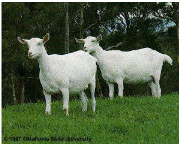
Gambar 6. Kambing Saanen