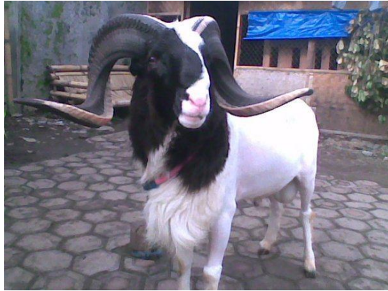
Gambar 7. Domba Garut