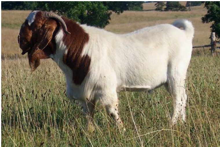
Gambar 5. Kambing Boer