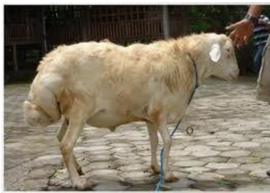
Gambar 9. Domba Ekor Gemuk