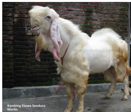
Gambar 2. Kambing Etawah