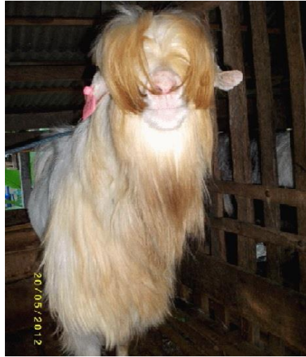
Gambar 4. Kambing Gembrong