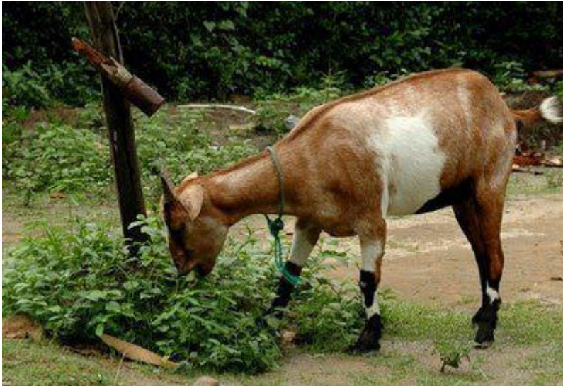
Gambar 1. Kambing Kacang