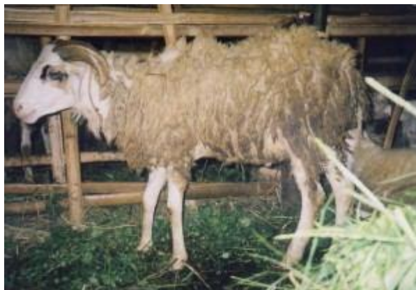
Gambar 8. Domba Ekor Tipis