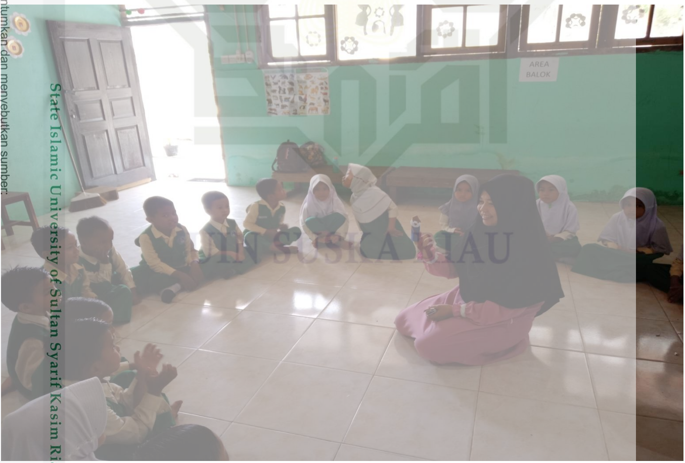
State Islamic University of Sultan Syarif Kasim Riau