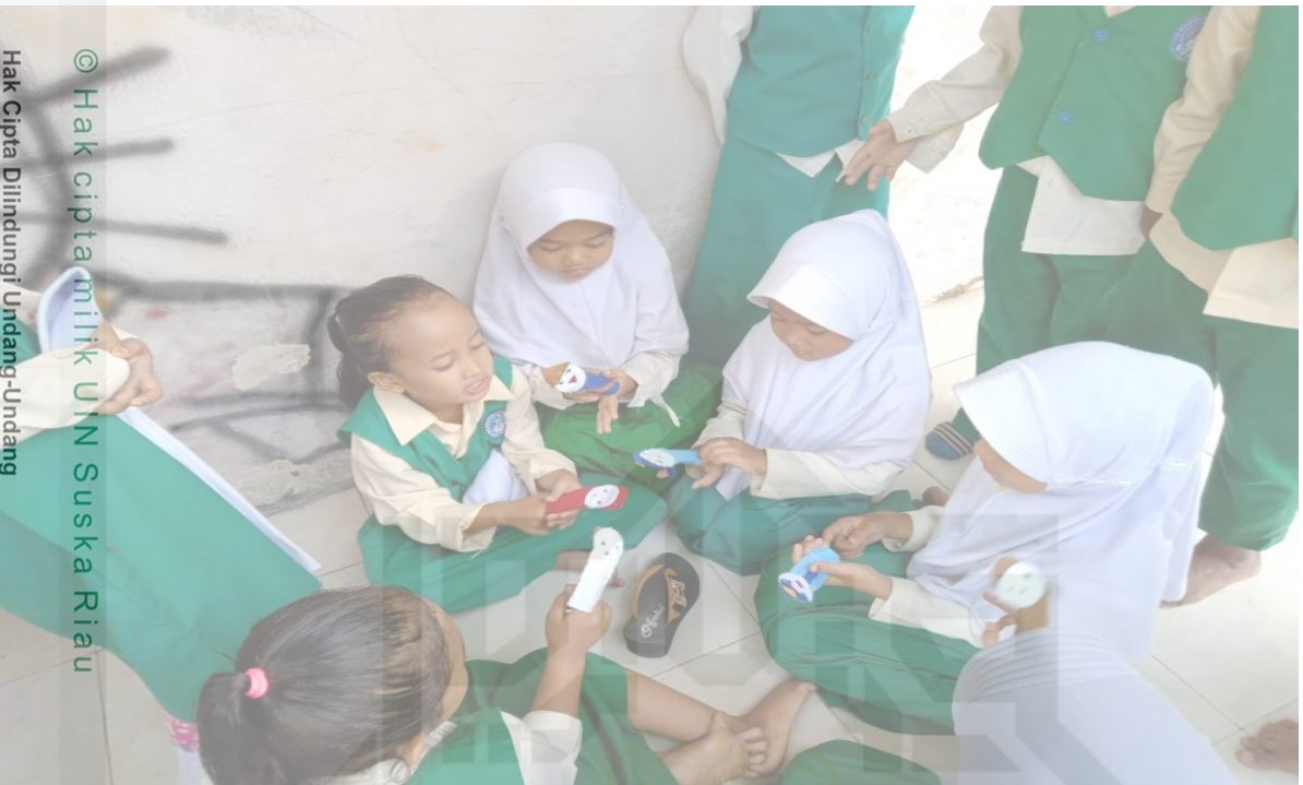
© Hak cipta milik UIN Suska Riau