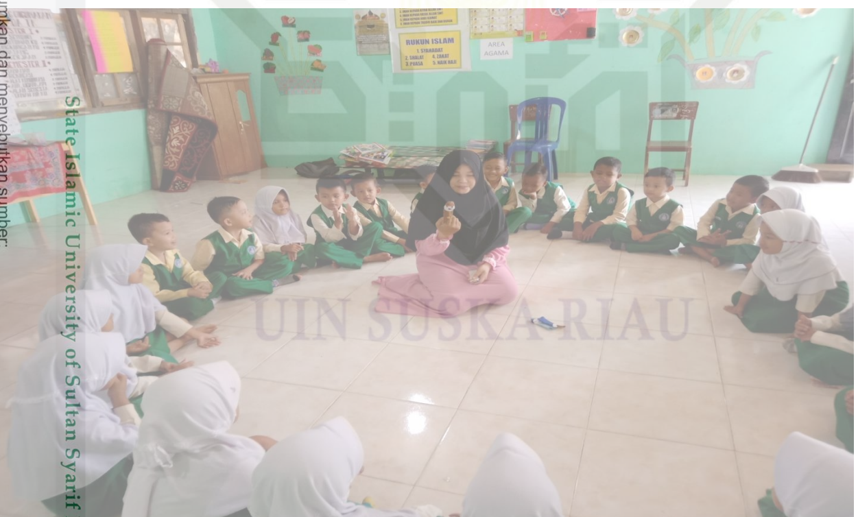
State Islamic University of Sultan Syarif Kasim Riau