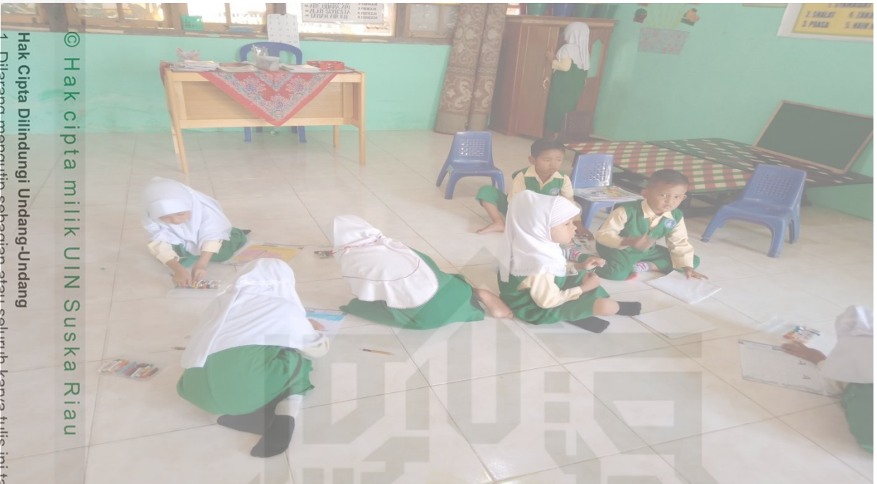
© Hak cipta milik UIN Suska Riau