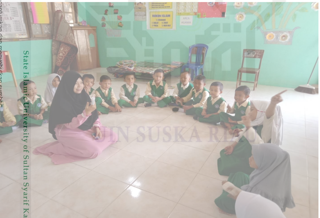
State Islamic University of Sultan Syarif Kasim Riau