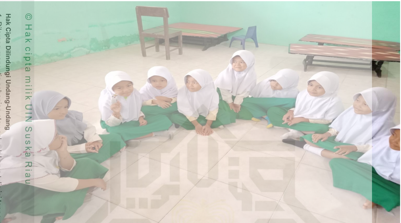
© Hak cipta milik UIN Suska Riau