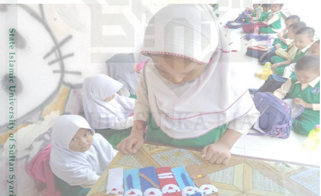
State Islamic University of Sultan Syarif Kasim Riau