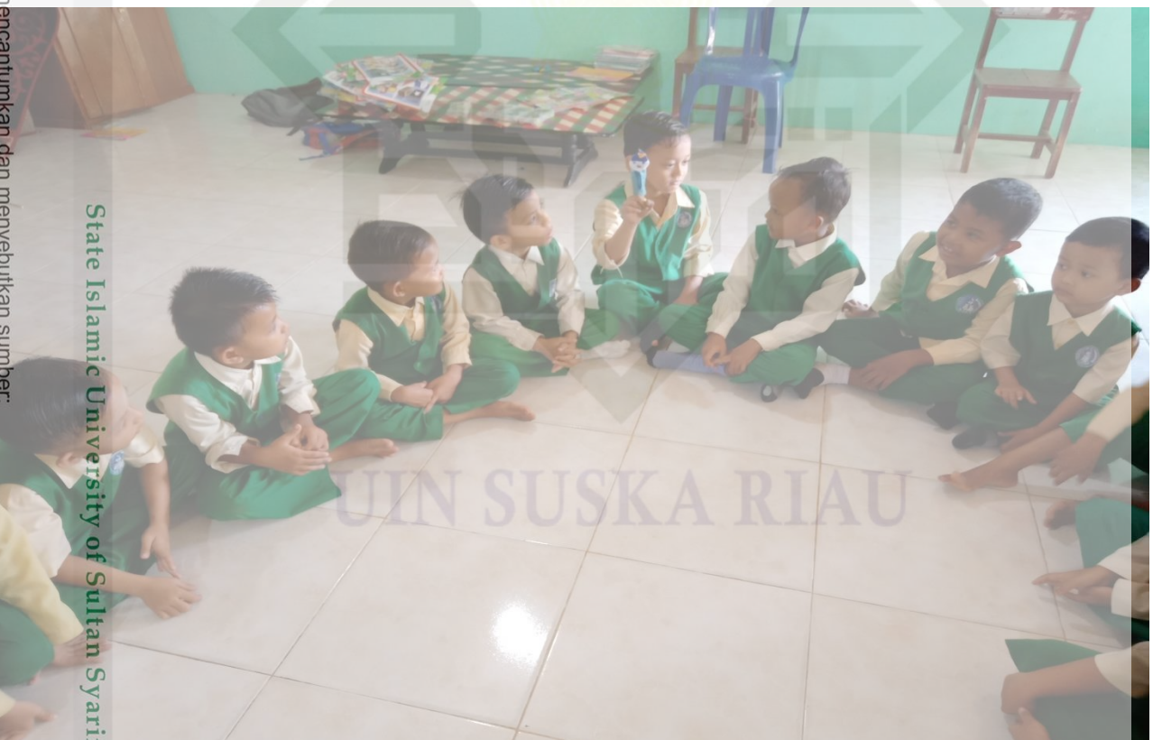
State Islamic University of Sultan Syarif Kasim Riau