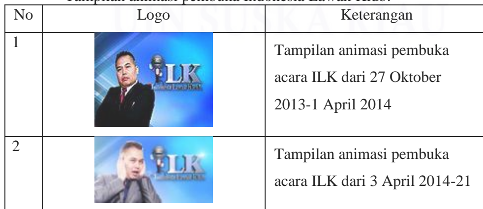
Tabel 4.3 Tampilan animasi pembuka Indonesia Lawak Klub: