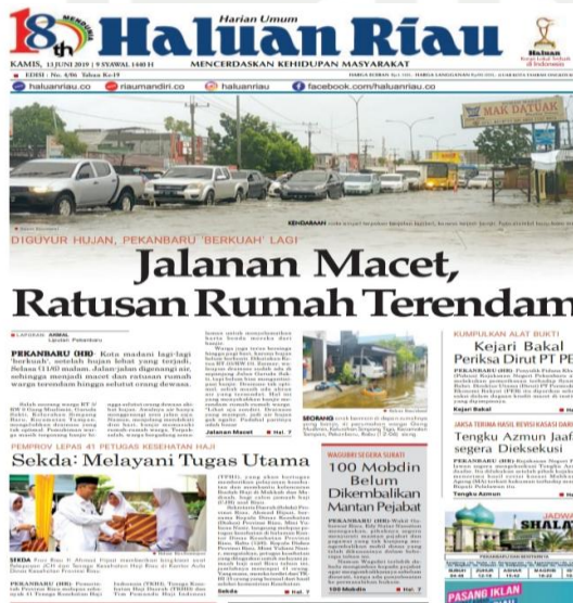
Sumber : surat kabar Haluan Riau edisi 13 Juni 2019