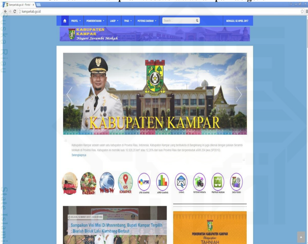
Gambar 1.1. Tampilan Website www.kamparkab.go.id

Website yang berkualitas mencerminkan lembaga atau instansi tersebut profesional. Website yang berkualitas dapat dicerminkan melalui berbagai kemudahan-kemudahan saat mengakses situs tersebut. Namun, kurang menyenangkan jika saat pengguna atau user mengakses website tersebut ia malah tidak menemukan laman yang ingin diakses seperti gambar dibawah ini.