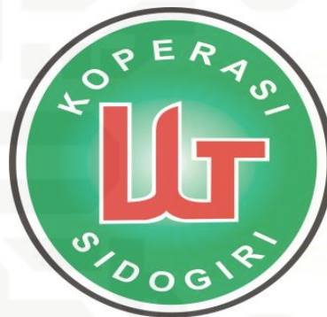
Gambar II. 2 Logo Koperasi BMT UGT Sidogiri