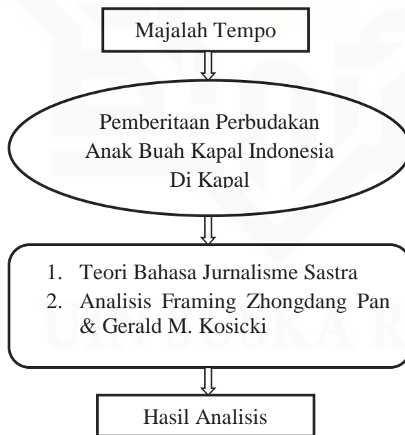
GAMBAR 2.3 Bagan Kerangka Pikir Penelitian