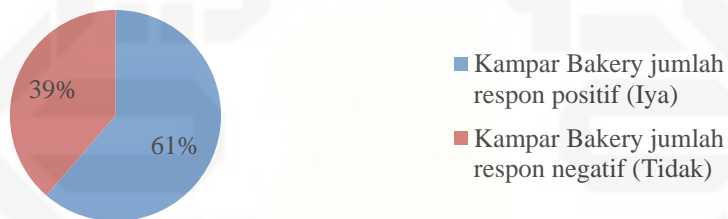
Gambar 1.3 Grafik Persentase Jumlah Konsumen Kampar Bakery

Dari hasil penyebaran kuesioner, pada Gambar 1.2 dapat dilihat bahwa 45% konsumen memberikan respon positif dan 55% konsumen memberikan respon negatif terhadap produk Permata Sari. Sedangkan pada Gambar 1.3 untuk produk Kampar Bakery 61% konsumen memberikan respon positif dan 39% konsumen memberikan respon negatif terhadap produk Kampar Bakery. Dari persentase jumlah konsumen di atas dapat disimpulkan bahwa konsumen lebih banyak memberikan respon positif terhadap produk Kampar Bakery dibandingkan dengan produk Permata Sari, sehingga mengakibatkan terjadinya penurunan penjualan produk Permata Sari. Untuk itu perlu dilakukan identifikasi terhadap keunggulan, kelemahan dan ancaman yang dialami Permata Sari serta memanfaatkan kekuatan menjadi sebuah peluang agar dapat bertahan di dunia usaha.