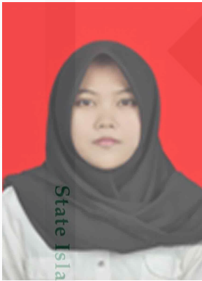
State Islamic University of Sultan Syarif Kasim Riau